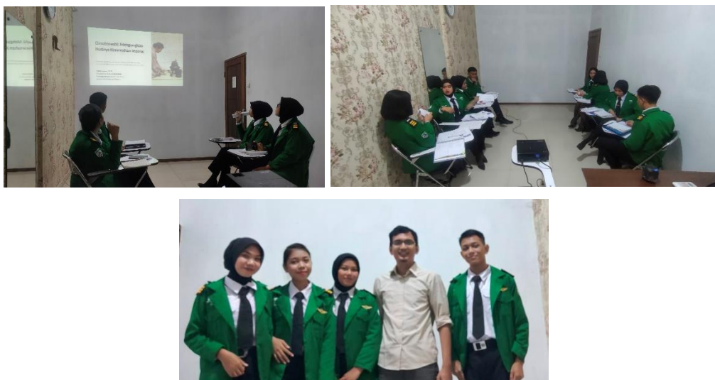
Gambar 3. Peserta menyimak penjelasan dan berdiskusi dan dokumentasi bersama narasumber

Namun demikian, observasi selama simulasi menunjukkan peningkatan yang nyata dalam komunikasi non-verbal peserta. Aspek-aspek seperti kontak mata, postur tubuh, dan ekspresi wajah yang semula kurang diperhatikan, menjadi lebih terkontrol dan disengaja setelah pelatihan. Perubahan ini terutama terlihat dalam simulasi menangani keluhan penumpang, di peserta belajar mengelola emosi dan menunjukkan empati melalui bahasa tubuh.