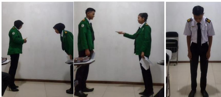
Gambar 2. Praktik simulasi Ojigi

Namun demikian, observasi selama simulasi menunjukkan peningkatan yang nyata dalam komunikasi non-verbal peserta. Aspek-aspek seperti kontak mata, postur tubuh, dan ekspresi wajah yang semula kurang diperhatikan, menjadi lebih terkontrol dan disengaja setelah pelatihan. Perubahan ini terutama terlihat dalam simulasi menangani keluhan penumpang, di peserta belajar mengelola emosi dan menunjukkan empati melalui bahasa tubuh.